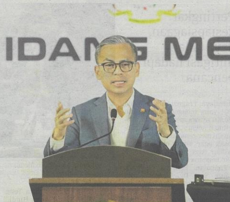
Fahmi pada sidang media selepas Mesyuarat Kabinet di Putrajaya, semalam.

Pada pembentangan Belanjawan 2025 minggu lalu, Anwar mengumumkan gaji minimum dinaikkan daripada RM1,500 kepada RM1,700, manakala pekerja asing akan diwajibkan mencaur kepada Kumpulan Wang Simpanan Pekerja (KWSP).