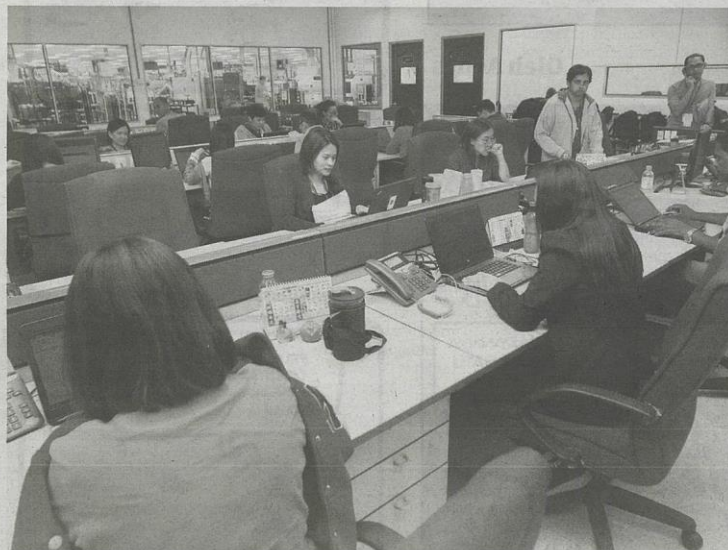
TINDAKAN keras mengikut peruntukan undang-undang sedia ada boleh dikenakan sekiranya majikan gagal mematuhi Perintah Kadar Gaji Minimum.